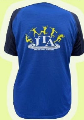
T-SHIRT Adulte 15€ □