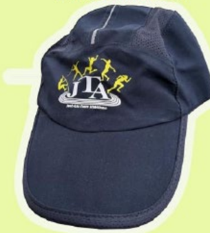
CASQUETTE 15€ □