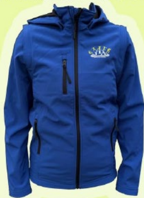
VESTE CONVERTIBLE 65€ □