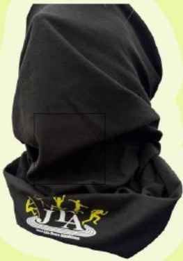
TOURS DE COU 5€ □