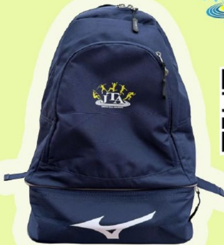
SAC D'ENTRAINEMENT 35€ □