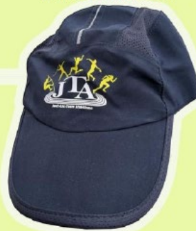
CASQUETTE 15€ □

Choisissez le(s) produit(s) qui vous convient, indiquez la taille désirée. La commande sera prise en compte uniquement après réception du paiement.